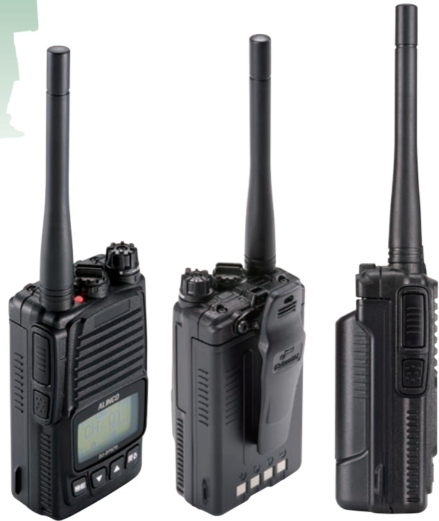
背面が平らになる標準バッテリー

※ DR-DPM60本体は防水構造ではありません。別売のスピーカーマイクEMS-500/501は防水ですが、本体が濡れると故障の原因になるのでご注意ください。